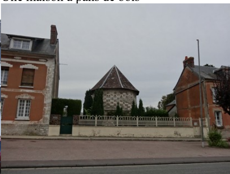
Un ancien colombier