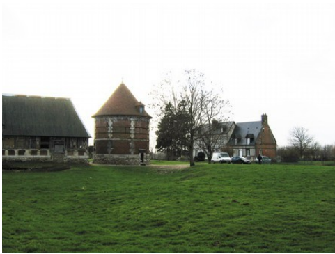
Le colombier et le corps de logis