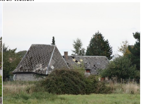
L'habitat rural alentours