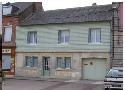
Une maison avec pierre et bardage