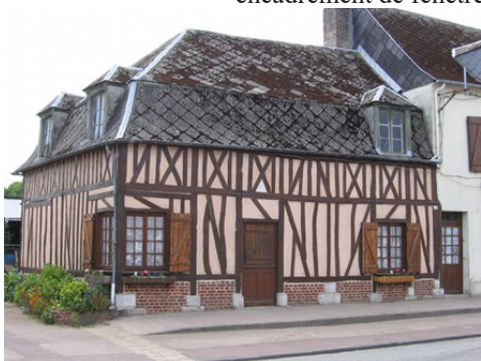
Quelques maisons de Bourneville

Les avis seront cohérents avec ceux émis ces dernières années, à savoir : pas de maisons à volume compliqué (type V, W, Y, ou Z), pentes à 45° pour les volumes principaux, ardoise ou tuile plate de teinte brun vieilli, à 20u/m 2 , avec un débord de toiture de 20cm, enduit de teinte beige clair avec modénatures (au choix : chaînages, encadrement de fenêtres, soubassement, colombage...). *Voir les autres fiches.