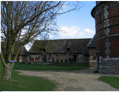
L'ancienne cour et ses dépendances