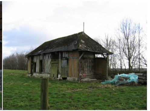
Une grange à pan de bois