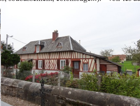
Une maison à pans de bois