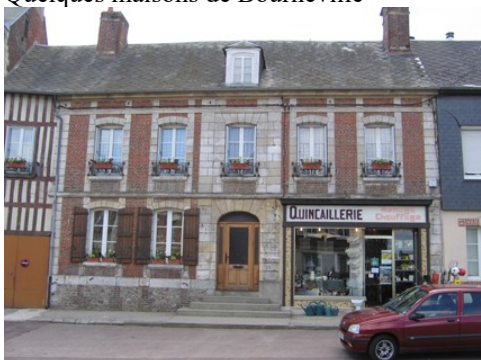
Un édifice mêlant brique et pierre